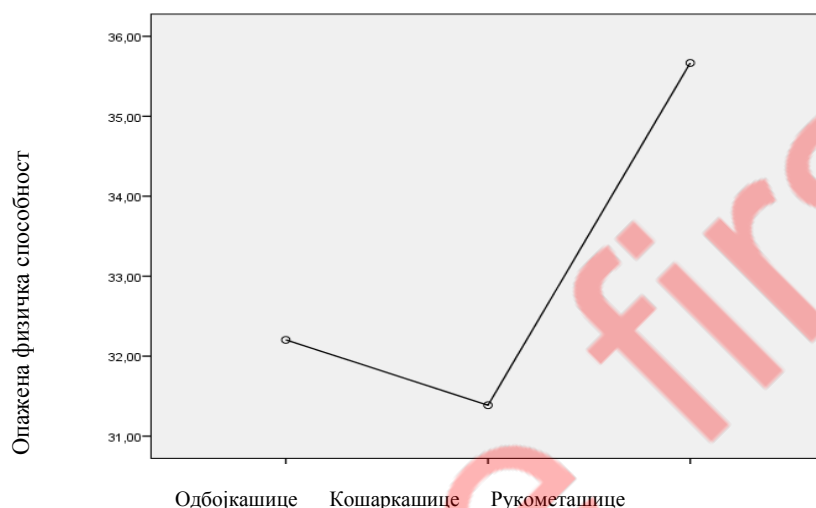
Слика 2 Разлике у опаженој физичкој способности у односу на врсту спорта

једносмерна анализа варијансе. Резултати показују да статистички значајне разлике постоје само када је у питању опажена физичка способност ( F(2,110)=4.42, p=.014 ) и то у корист рукометашица у односу на одбојкашице и кошаркашице (Слика 2.). Рукометашице постижу највише скорове на опажена физичка способност, што указује на веће самопоуздање у сопствене физичке способности, у односу на одбојкашице и кошаркашице. Кошаркашице постижу најниже скорове на опажене физичке способности, што указује на ниже самопоуздање у сопствене физичке способности.